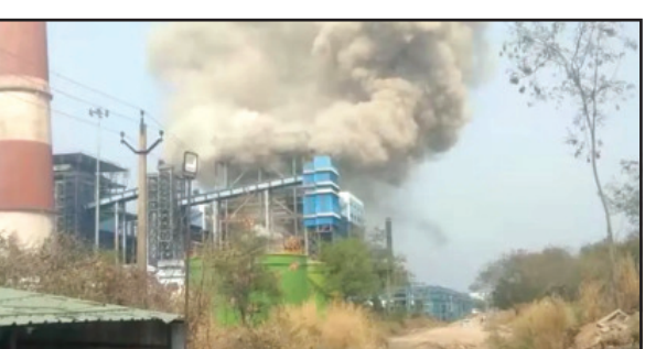
ଆହତମାନଙ୍କ ପାଇଁ ଉଦ୍ଧାର ନିକଟରେ ପ୍ରାର୍ଥନା କରୁଛି । ଆହତମାନେ ଶୀଘ୍ର ସୁସ୍ଥ ହୋଇଯାଆନ୍ତୁ । ପୁନାମ ପ୍ରଶାସନ ପ୍ରଭାବିତ ଲୋକଙ୍କ ସହାୟତା କରୁଛନ୍ତି । ପ୍ରଧାନମନ୍ତ୍ରୀ ରିଲିଫ ଫାଣ୍ଡରୁ ମୃତକମାନଙ୍କ ସଂପର୍କୀୟମାନଙ୍କୁ ୨ ଲକ୍ଷ ଏବଂ ଆହତମାନଙ୍କୁ ୫୦,୦୦୦ ଟଙ୍କା ଲେଖାଏଁ ସହାୟତା ପ୍ରଦାନ କରାଯିବ । ମୁଖ୍ୟମନ୍ତ୍ରୀ ବିଷୁଦେବ ସାୟ

ରାୟପୁର, ୧୪:୪: ଛତିଶଗଡ଼ର ଶକ୍ତି କିଲ୍ଲାର ସିନା ତରାଇସ୍ଥିତ ଏକ କାରଖାନାରେ ଆଜି ସନ୍ଧ୍ୟାରେ ଏକ ବିସ୍ଫୋରଣ ଘଟିଛି । ଛତିଶଗଡ଼ ବେଦାନ୍ତ ପାଠାଳୟ ପ୍ରାଙ୍ଗଣରେ ଗୁରୁତର ବିସ୍ଫୋରଣ ଘଟିଛି । ୩୦ରୁ ୪୦ ଶ୍ରମିକ ଗୁରୁତର, ବଢ଼ିପାରେ ମୃତକଙ୍କ ସଂଖ୍ୟା