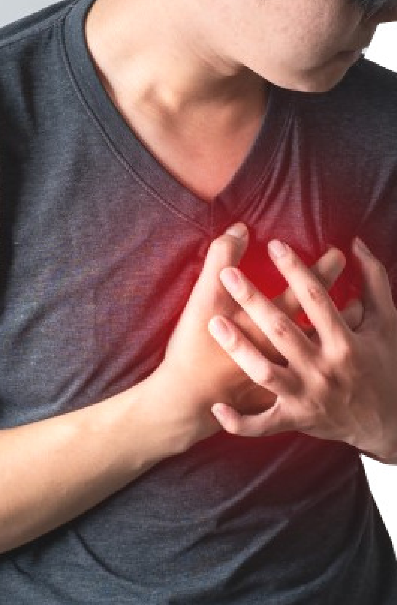
ହୃଦୟାତର ଖବର ପାଇଁ ଗୋଫାଳୀଙ୍କୁ ଦୁର୍ଘାତ

ଦ୍ୱିତୀୟ ଷ୍ଟଡି: ଆଇସିଏମଆର ର ରିପୋର୍ଟ ଆଇସିଏମଆର ର ନ୍ୟାସନାଲ ଇଣ୍ଟରନାସନାଲ ଇଉଡିଏ (ଏନଆଇଏସି) ମେ'ରୁ ଅଗଷ୍ଟ ୨୦୨୩ ମଧ୍ୟରେ ଏହି ଷ୍ଟଡି କରିଥିଲା । ଏଥିରେ ୧୯ଟି ରାଜ୍ୟ ଏବଂ କେନ୍ଦ୍ରଶାସିତ ପ୍ରଦେଶର ୪୭ଟି ବଡ଼ ହସ୍ପିଟାଲରୁ ତାତା ନିଆଯାଇଥିଲା । ଏଥିରେ ୧୮ରୁ ୪୫ ବର୍ଷ ବୟସର ସେହି ଲୋକମାନଙ୍କୁ ସାମିଲ କରାଯାଇଥିଲା, ଯେଉଁମାନେ ପୂର୍ବରୁ ସମସ୍ତ ସ୍ୱସ୍ଥ ଦେଖାଯାଉଥିଲେ କିନ୍ତୁ ଅକ୍ଟୋବର ୨୦୨୧ ରୁ ମାର୍ଚ୍ଚ ୨୦୨୩ ମଧ୍ୟରେ ହୃଦୟାତର ମୃତ୍ୟୁ ହୋଇଗଲା । ଏହି ରିପୋର୍ଟର ଫଳାଫଳ ସ୍ପଷ୍ଟ ଅଛି ଯେ କୋଭିଡ-୧୯ ଟିକା ନେବା ଦ୍ୱାରା ହୃଦୟାତର ବିପଦ ବହୁତ ନାହିଁ ।