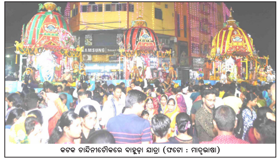
କଟକ ରାଜନୀତିକରେ ବାହୁଡ଼ା ଯାତ୍ରା

ସମ୍ପୃକ୍ତ ରହିଛି । କେନ୍ଦ୍ର ସମବାୟ ମନ୍ତ୍ରୀ କହିଛନ୍ତି, ପୂର୍ବରୁ ସମବାୟ କ୍ଷେତ୍ରର ବିକାଶ ପାଇଁ କର୍ମଚାରୀ ଏବଂ ସମବାୟ ସମିତିର ବୋଲି ସେମାନେ ଜାଣି ପାରିବେ । ଏହି ବିଶ୍ୱବିଦ୍ୟାଳୟ ଦ୍ୱାରା ସମବାୟ କ୍ଷେତ୍ରର ଅନେକ ସମସ୍ୟାର ସମାଧାନ ହେବ ବୋଲି ସମବାୟ ମନ୍ତ୍ରୀ କହିଛନ୍ତି । ଶ୍ରୀ ଅମିତ ଶାହ କହିଛନ୍ତି, ପ୍ରଧାନମନ୍ତ୍ରୀ ମୋଦୀ ଦେଶରେ ୨ ଲକ୍ଷ ନୂତନ ପ୍ରାଥମିକ କୃଷି ଋଣ ସମିତି (ପ୍ୟାଙ୍କୁ) ଗଠନ କରିବାକୁ ନିଷ୍ପତ୍ତି ନେଇଛନ୍ତି । ତଳିତ ବର୍ଷ ଶେଷ ପୂର୍ବା ୬୦ ହଜାର ନୂତନ ପ୍ୟାଙ୍କୁ ଗଠନ କରାଯିବ । ସେ କହିଥିଲେ ଯେ କେବଳ ୨ ଲକ୍ଷ ପ୍ୟାଙ୍କୁରେ ୧୭ ଲକ୍ଷ କର୍ମଚାରୀ ରହିବେ । ସେହିପରି ଅନେକ ଲକ୍ଷ ଡାଏରୀ ପ୍ରତିଷ୍ଠା କରାଯାଇ ଏବଂ ଏହା ପାଇଁ ପ୍ରଶିକ୍ଷିତ ମାନବ ସମ୍ବଳର ଆବଶ୍ୟକତା ମଧ୍ୟ ତ୍ରିଭୁବନ ସହକାରୀ ଯୁନିଭର୍ସିଟି ଦ୍ୱାରା ପୂରଣ କରାଯିବ । ଏହି ବିଶ୍ୱବିଦ୍ୟାଳୟ ସମବାୟ କ୍ଷେତ୍ରରେ ନାତି ନିର୍ଦ୍ଧାରଣ, ତଥ୍ୟ ବିଶ୍ଳେଷଣ ଏବଂ ଦେଶରେ ସମବାୟ ବିକାଶ ପାଇଁ ୫ ବର୍ଷ, ୧୦ ବର୍ଷ ଏବଂ ୨୫ ବର୍ଷ ଆ ଋଣମତି ପ୍ରସ୍ତୁତ କରିବା ଉପରେ କାର୍ଯ୍ୟ କରିବ । ସେ କହିଛନ୍ତି, ଏହି ବିଶ୍ୱବିଦ୍ୟାଳୟ ସହିତ ସମବାୟ କ୍ଷେତ୍ରରେ ପରିବାରବାଦୀ କେବଳ ସମବାୟ କର୍ମଚାରୀଙ୍କୁ ପ୍ରସ୍ତୁତ କରିବ ନାହିଁ ବରଂ ଭବିଷ୍ୟତରେ ସମବାୟ କ୍ଷେତ୍ରର ନେତୃତ୍ୱ ନେବ । ଏହି ଶିକ୍ଷାନୁଷ୍ଠାନ ତ୍ରିଭୁବନ ଦାସ ଜାକ ଭଳି ଉତ୍ପାଦକ ସମବାୟ ନେତା ମଧ୍ୟ ସୃଷ୍ଟି କରିବ । ସିଏଏସଇ ନବମରୁ ଦ୍ୱାଦଶ ଶ୍ରେଣୀ ପାଠ୍ୟକ୍ରମରେ ସମବାୟକୁ ବିଷୟ ଭାବରେ ଯୋଡ଼ିଛି । ଗୁଜରାଟ ସରକାର ମଧ୍ୟ ତାଙ୍କ ପାଠ୍ୟକ୍ରମରେ ସମବାୟ ବିଷୟ ଯୋଡ଼ିବା ଉଚିତ ଯାହା ଦ୍ୱାରା ସାଧାରଣ ଲୋକମାନେ ସମବାୟ ବିଷୟରେ ଜାଣିପାରିବେ ।