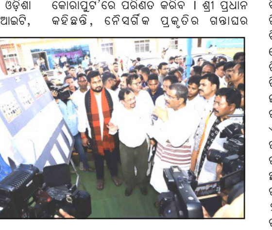
କୋରାପୁଟରେ ପରିଷଦ କରିବା । ଶ୍ରୀ ପ୍ରଧାନ କହିଛନ୍ତି, ନୈସର୍ଗିକ ପ୍ରକୃତିର ଗଠାଘର

ଜଣାଇଛନ୍ତି ଶ୍ରୀ ପ୍ରଧାନ । ସେ କହିଛନ୍ତି, ଓଡ଼ିଶା କେନ୍ଦ୍ରୀୟ ବିଶ୍ୱବିଦ୍ୟାଳୟ, କୋରାପୁଟ, ଆଇଆଇଟି, ଭୁବନେଶ୍ୱର, ଏନଆଇଟି ଭାରତକେଲା, ଆଇଆଇଏମ, ସମ୍ବଲପୁର, ଆଇଇଆଇ, ଗୁରୁପୁର ଏବଂ ଶ୍ରୀସଦାଶିବ କ୍ୟାମ୍ପସ(କେନ୍ଦ୍ରୀୟ ଫାପୁଟ ବିଶ୍ୱବିଦ୍ୟାଳୟ), ପୁରୀ ମଧ୍ୟରେ ଏମପିୟୁ ଜାତୀୟ ଶିକ୍ଷା ନୀତି - ୨୦୨୦ର ଲକ୍ଷ୍ୟକୁ ପୂରଣ କରିବା ଦିଗରେ ସହାୟକ ହେବ । ବହୁମୁଖୀ ଶିକ୍ଷା, ଗବେଷଣା, ଏକାଡେମିକ୍ ବ୍ୟାଙ୍କ ଅଫ୍ କ୍ରେଡିଟ୍ ମାଧ୍ୟମରେ କ୍ରେଡିଟ୍ ସ୍ଥାନାନ୍ତର, ଯୁଗ୍ମ ଡିଗ୍ରୀ କାର୍ଯ୍ୟକ୍ରମ ଏବଂ ଭାରତୀୟ ଜ୍ଞାନ ପ୍ରଣାଳୀକୁ ପ୍ରୋତ୍ସାହନ ଦେବା ଦିଗରେ ଏହି ବୁଝାମଣା ବିଶେଷ ସହାୟକ ହେବ । ଜନଜାତି ସୁରକ୍ଷାକୁ ସମ୍ମତ କରିବା, ସ୍ତ୍ରୀ ଏବଂ ଡିଜିଟାଲ ଶିକ୍ଷାକୁ ପ୍ରୋତ୍ସାହନ ଦେବା, ନବଯୁଗର ଏବଂ ଉଦ୍ୟମିତାକୁ ପଦାର୍ପନ କରିବା ଏବଂ ଶୈକ୍ଷିକ ଏବଂ ଗବେଷଣା ଭିତ୍ତିଭୂମିର ଆଧୁନିକୀକରଣ ଦିଗରେ ଏହା ସ୍ୱାଗତଯୋଗ୍ୟ ପଦକ୍ଷେପ । ଆଜି ଏଠାରେ ସେହିପରି ଓଡ଼ିଶାର ୬ଟି ଅଗ୍ରଣୀ କେନ୍ଦ୍ରୀୟ ଉଚ୍ଚ ଶିକ୍ଷାନୁଷ୍ଠାନ ମଧ୍ୟରେ ଏତି ହାସିଲ ବୁଝାମଣା ହୋଇଥିବା ବୁଝାମଣା ପତ୍ର କୋରାପୁଟକୁ ଏକ 'ଗ୍ରାଣ୍ଡ